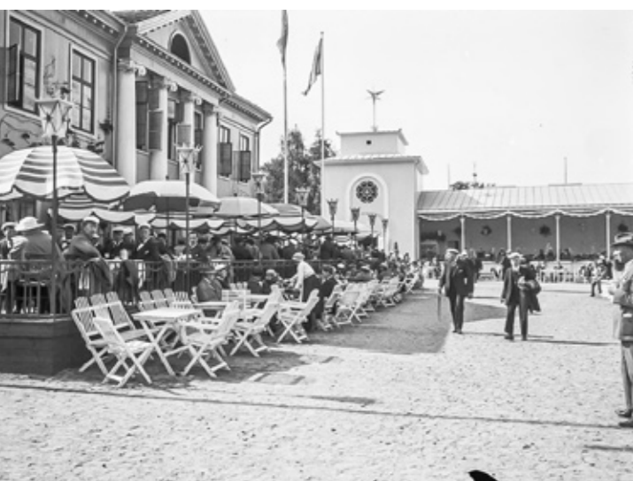
Wårdshuset på Liseberg 1923.