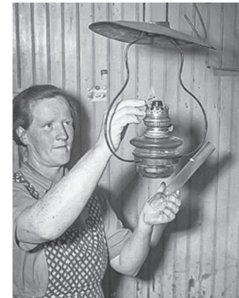
Fotogenlampan tänds.

Kanske sitta tysta och lyssna till husets ljud, eller höra vinden eller regnet utanför. Vi kanske behöver återinföra denna tid för en stunds stillhet och reflektion?