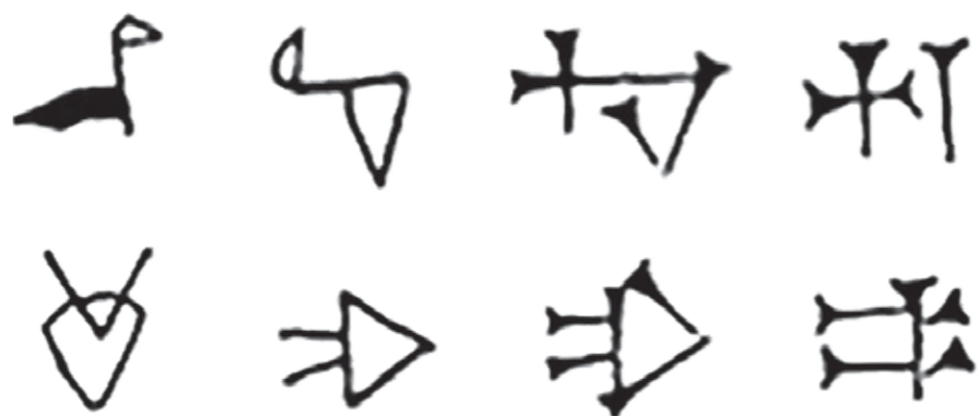
Exempel på kilskrift