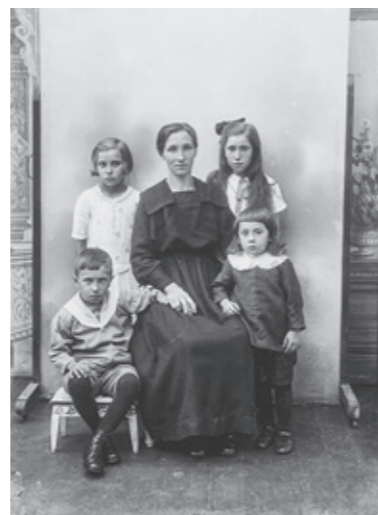
Foto taget av Hedvig von Schedvin f. Läckgren som var den siste fotografen i fotoateljén på Nösund in på 1950-talet.

Fler foton tagna av de kvinnliga fotograferna på Nösund finns på digitaltmuseum.se , sök på fotografens namn.