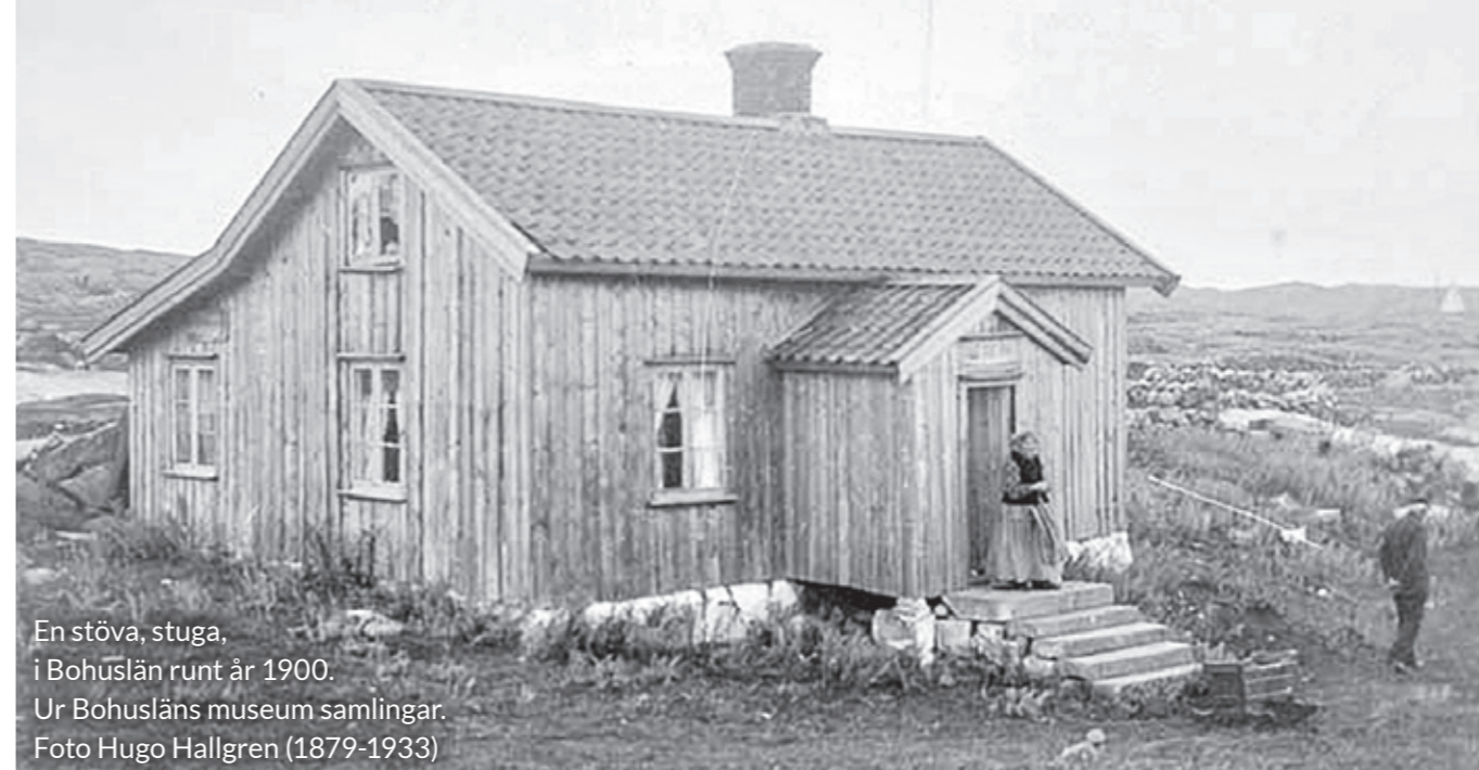
En stöva, stuga, i Bohuslän runt år 1900. Ur Bohusläns museum samlingar.