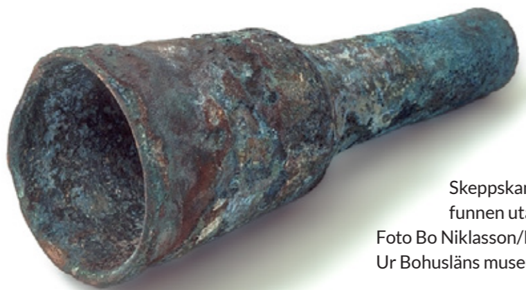
Skeppskanon i brons funnen utanför Marstrand.