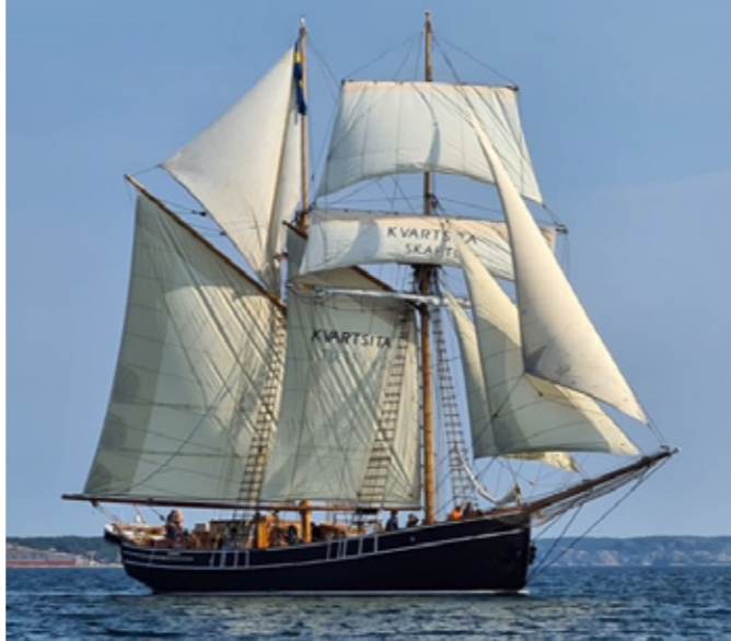
Föreningen För Fulla segels toppsegelskonare Kvartsita . Kvartsita har sin hemmahamn vid Kyrkekajen i Fiskebäckskil där föreningen också har sin samlingslokal.

För att uppnå målet bedrivs verksamhet året runt, allt knutet till föreningens toppsegelskonare Kvartsita . Från maj–oktober genomförs seglingar av alla slag: lägerskolor, klassresor, företagsseglingar och 50-årskalas. Resten av året fokuseras på underhåll av båten och utbildning av besättningen ombord. Under sommaren kan du följa