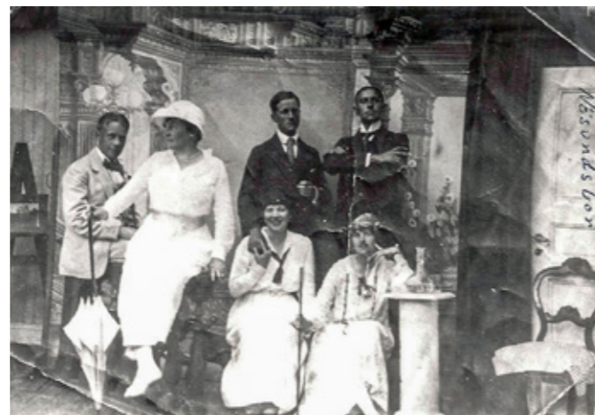
Nösundsbor står det skrivet på fotografiet. Bild tagen i fotoateljén på Nösund.

Foto taget av Hedvig von Schedvin f. Läckgren som var den siste fotografen i fotoateljén på Nösund in på 1950-talet.