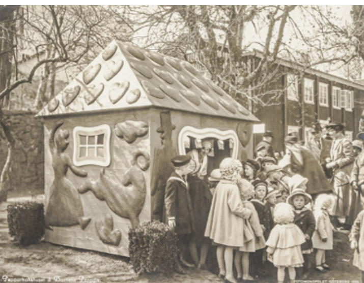
Pepparkakshuset i Barnens paradiset på Göteborgsutställningen 1923.

Världens största restaurang, minareter, ett fyrtorn och en linbana. Det var några av inslagen i jubileumsutställningen som ägde rum i Göteborg för hundra år sedan. Nu uppmärksammas utställningen på nytt under Göteborgs 400-årsjubileum.