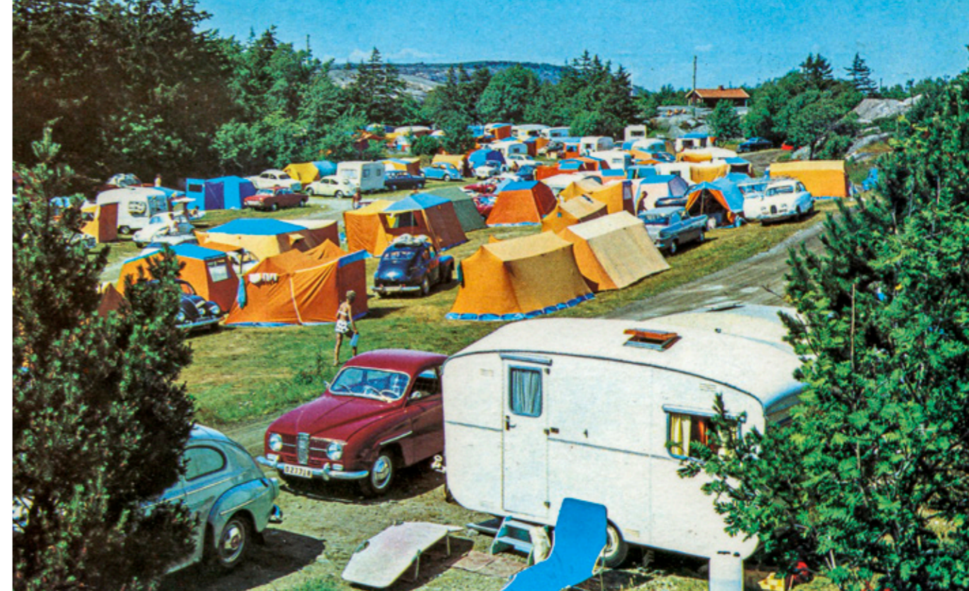
Sälviks camping strax söder om Fjällbacka på 1960-talet.