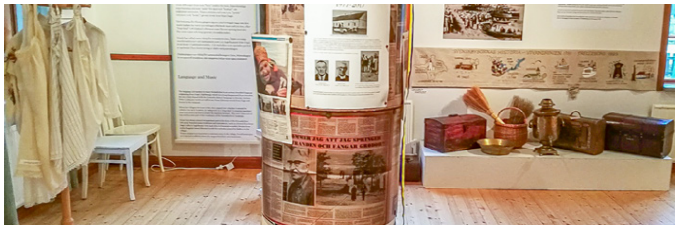
Delar av utställningen i Svenska Bygården i Roma på Gotland. Här berättas om om svenskbybornas historia.

malsvenskby, de planerna är lagda på is i och med Rysslands invasion av Ukraina.