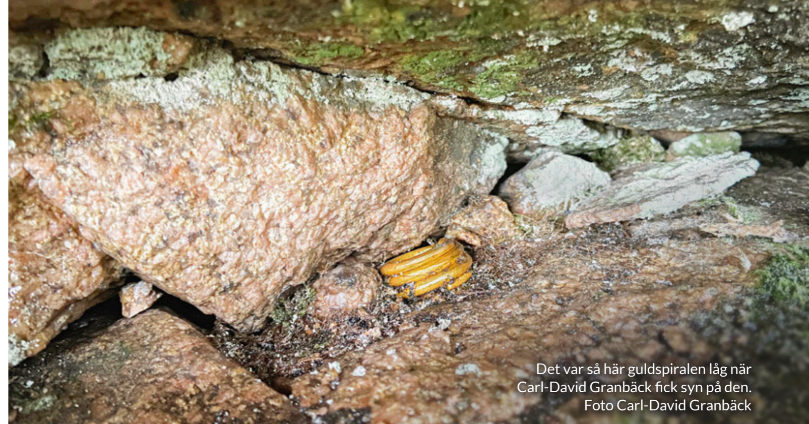
Det var så här gulds spiralen låg när Carl-David Granbäck fick syn på den.