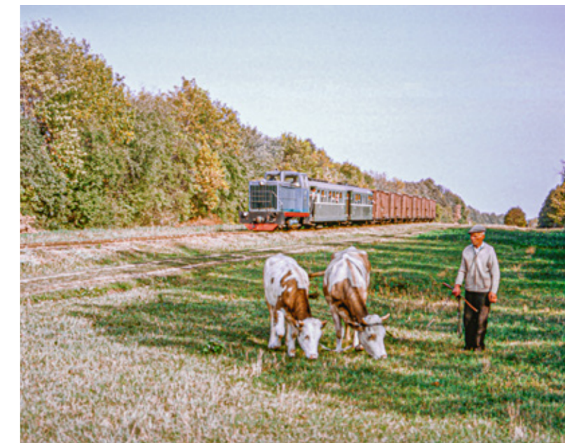
Foto från järnvägssträckan mellan Vapnyarka i sydvästra Ukraina till Lobriivka i södra Ukraina. Foto från september 1994 av Bo Gyllenberg Ur Järnvägs museets samlingar, Digitalt museum