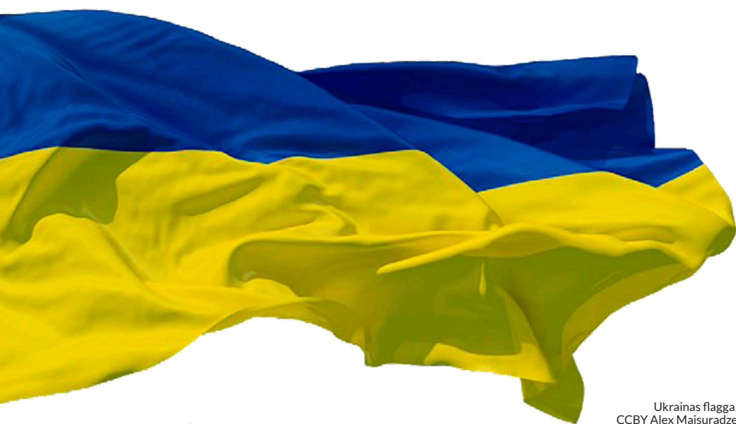
Ukrainas flagga.