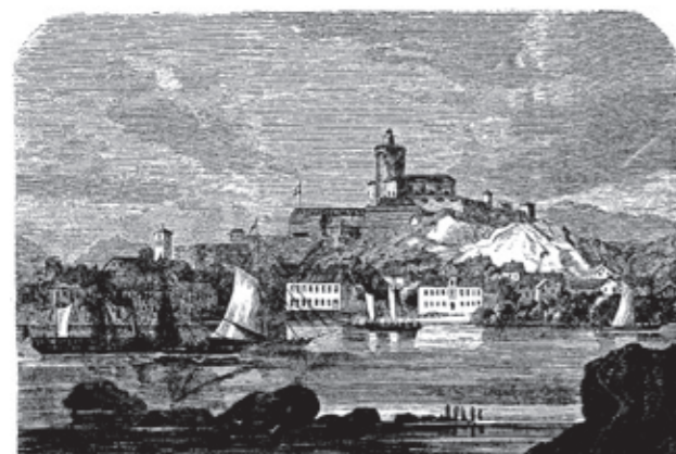
Karlstens fästning (ur Svenska Familj-Journalen 1867).

Redaktionen förbehåller sig rätten att redigera och förkorta insänt material.