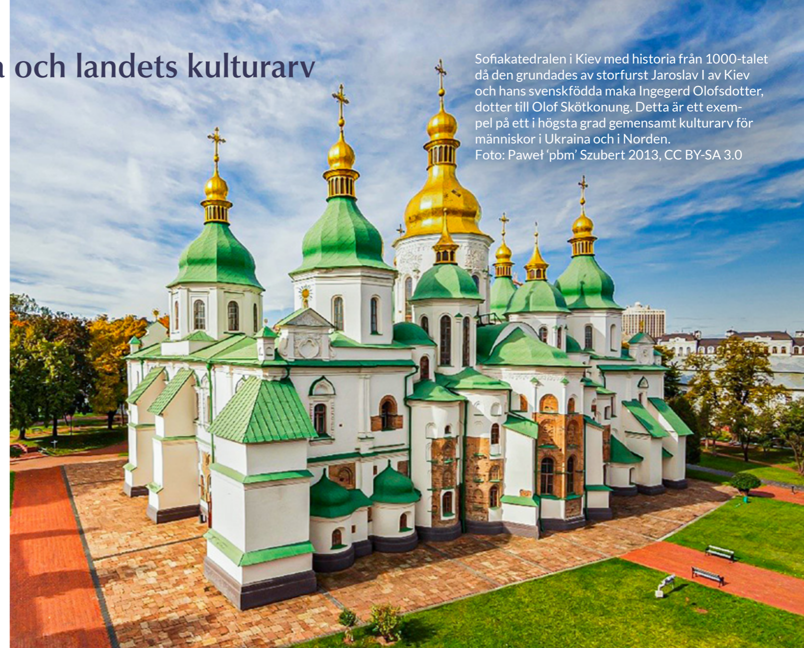
Sofiakatedralen i Kiev med historia från 1000-talet då den grundades av storfurst Jaroslav I av Kiev och hans svenskfödda maka Ingegerd Olofsdotter, dotter till Olof Skötkonung. Detta är ett exempel på ett i högsta grad gemensamt kulturarv för människor i Ukraina och i Norden.

Samtidigt som årets demokrati rapport avslutades av Varieties of Democracy-institutet, V-Dem, vid Göteborgs universitet, skedde Rysslands invasion av Ukraina. Invasionen av Ukraina bekräftar det som V-Dem varnat för under flera års tid, demokratisk tillbakagång i världen, så kallad autokratisering. Autokratiseringen