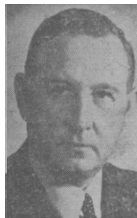
DIR. E NYBERG, Svanö, följde med stor uppmärksamhet förhandlingarna.

Det är inte ofta i en liknande förhandling man hör en motpart erbjuda den andre att ta för sig mer.