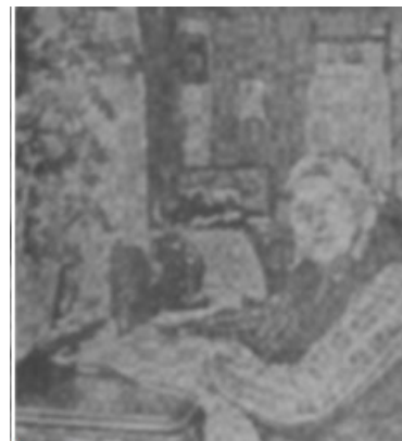
Symaskinen är från 1897, men nog går det att se på den lika bra som på de nya, säger snart

— Det är Gud som hjälper mig, menar hon. En gång när han hjälpte mig mer än vanligt, glömmet jag aldrig. Det var då jag var 75. Jag skulle sköta småbarnen åt sonen. Det vet man väl hur kvadda far; Rätt vad det var, hade de skjutit locket av brunnen och minsten på tre år ramlade i. Jag ' var ensam hemma. Då var det inte så lätt att vara farmor. Enda i sättet att rädda pojken var att kliva ned i brunnen. Och det gjorde jag, fick tag i pojken och tog mig upp igen. Brunn var djup och bred och ja? hade aldrig klarat mig om inte Gud hjälpt mig. Hon ska veta att Gud är bra att ha. Det är tryggt på gammeldagarna.