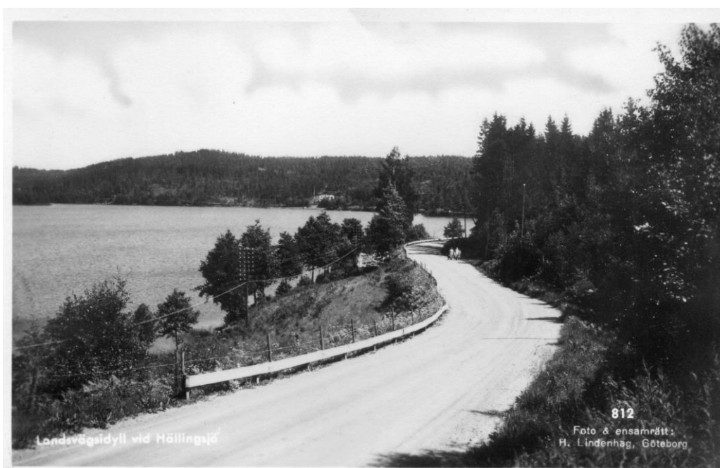
Den gamla landsvägen mellan Eriksmyst och Gästgivargården.

Vägen genom Hällingsjö kom att dras om under sent 1960t. Tidigare gick vägen förbi den s.k Pålen vid Eriksmyst och utmed sjön fram till Gästgivargården och sedan vidare in på dagens Garveriväg.