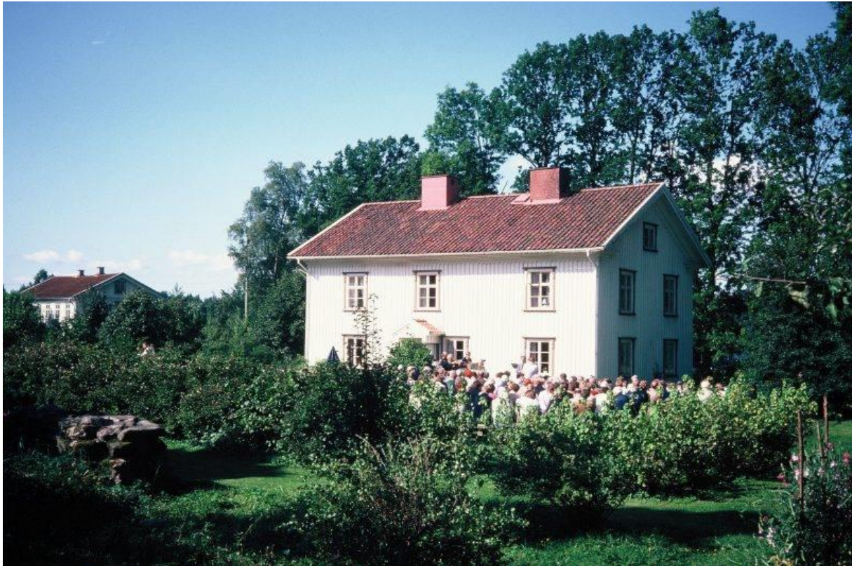
Marieberg Hällingsjö 1979

Familjen Claesson bodde kvar under lång tid och först på senare år har fastigheten gått ur släkten.