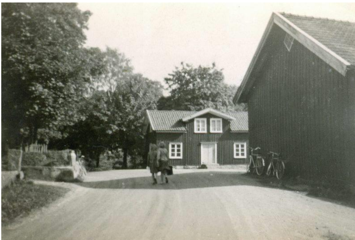
Landsvägen genom Gästgivargården ca 1940t. Gamla posthuset och handelsboden rakt fram i bild.

Vägen genom Hällingsjö kom att dras om under sent 1960t. Tidigare gick vägen förbi den s.k Pålen vid Eriksmyst och utmed sjön fram till Gästgivargården och sedan vidare in på dagens Garveriväg.