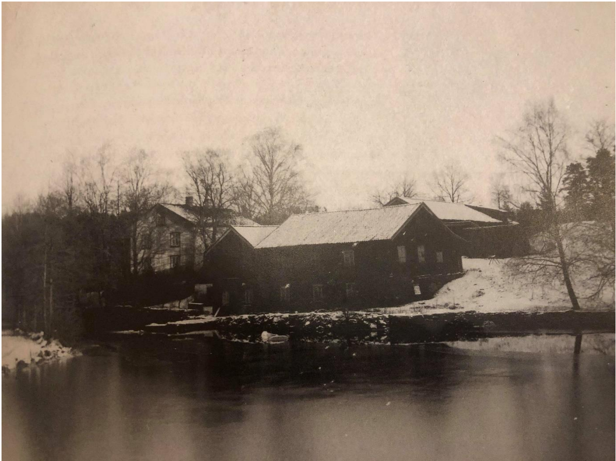
Garveriet i Hällingsjö tidigt 1900t.