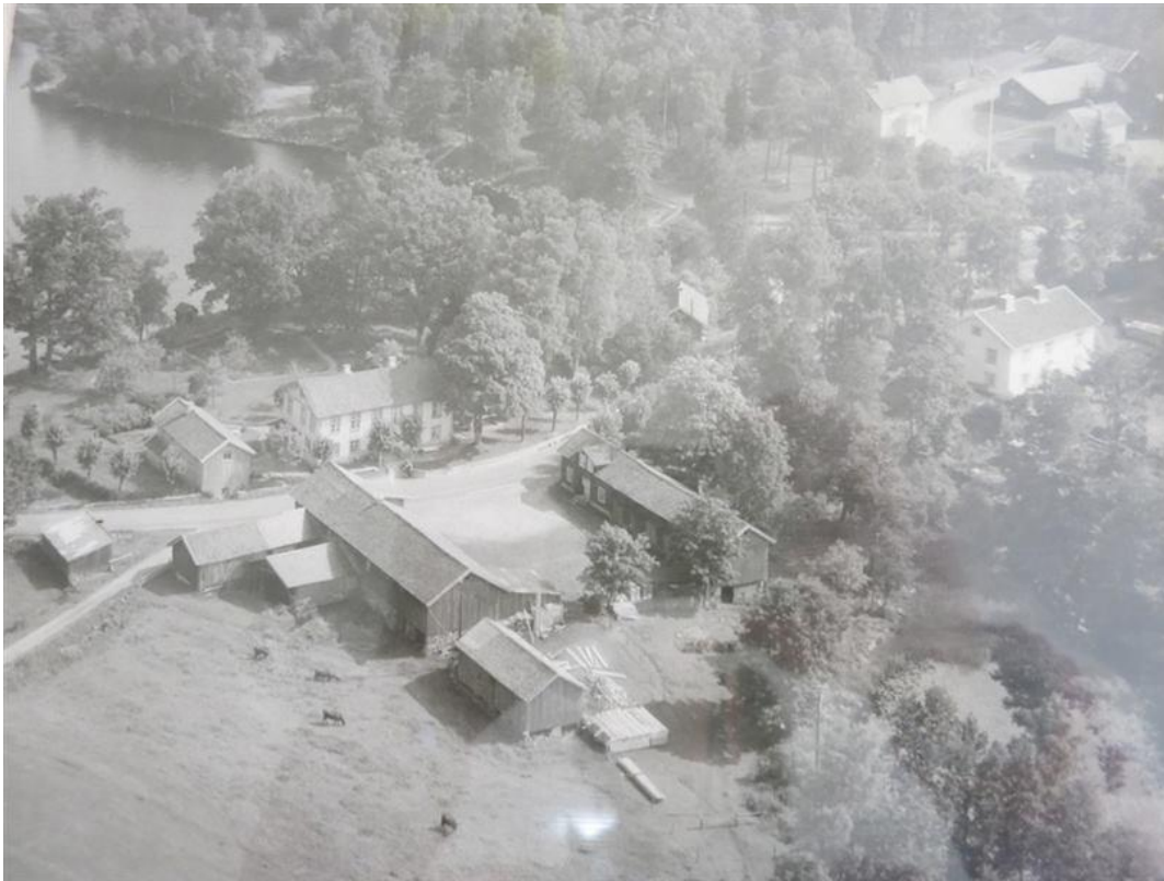
Gästgivargården med alla sina byggnader ca 1930-40t.

1829 Flyttas Gästgiveriet från Stora Bugärde (Bygärde) till Hällingsjö. Eftersom gästgiverier vid denna tid hade krav om att hålla skjutshållning för resande var det svårt att få skjuts i tid då gårdarna låg långt från gästgiveriet i Stora Bugärde. Gårdarna hade ett skjutsschema där man blev kallade med bud från gästgiveriet när någon resande önskade skjuts. För en fastställd summa skulle man inom en viss tid inställa sig på gästgivargården med man och häst för vidare ombesörja resandens skjuts antingen till en plats inom socknen eller till nästa skjutshåll där en annan skjutshållare tog över den resandes färd. Platsen för det nya gästgiveriet blev Hällingsjöos där flera vägar möttes. Här gick vägarna till Borås och Göteborg liksom till Skene och Kungsbacka. Läser man de gamla skyltar som stod utanför gästgiveriet anges mer lokala destinationer som Flässjum och Bonared. Vid Hällingsjöos låg tidigare ett torp Hällingsjö soldatstom, som under slutet av 1700t ansökt om tillstånd att sälja brännvin, det var länsman Ternstedt på Hällingsjö som ville driva detta enklare