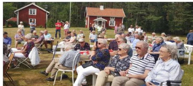
Sid. 5 Hembygdsgården – en plats att trivas på i god gemenskap

En fin tradition sedan många år Kaffe och våfflor, tipsrunda. (Gr 4)