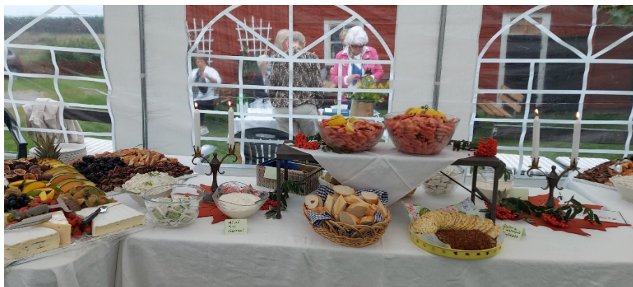
Exotisk planka och räkfrossa, som blev till stor belåtenhet