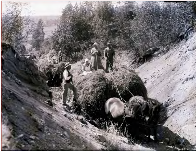
Hölass som transporteras genom grustag i Badelundaåsen vid Tibble by, år 1926.

Badelundaåsens natur- och kulturstig har tillkommit genom ett samarbetsprojekt mellan Stiftelsen Kulturmiljövård, Västerås stad och Badelunda hembygdsförening. Projektet har haft som mål att öka tillgängligheten genom att förbättra det spontana stigsystemet i åslandskapet kring Anundshög vid Badelundaåsen.