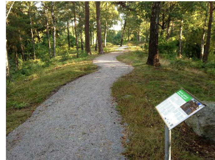
Informationsskyltar om natur- och kultur med audioguiden finns längs stigen.

Badelunda natur- och kulturstig börjar vid Anundshög, Sveriges största gravhög, och tar dig sedan längs den vackra Badelundaåsen och genom den gamla Tibble by.