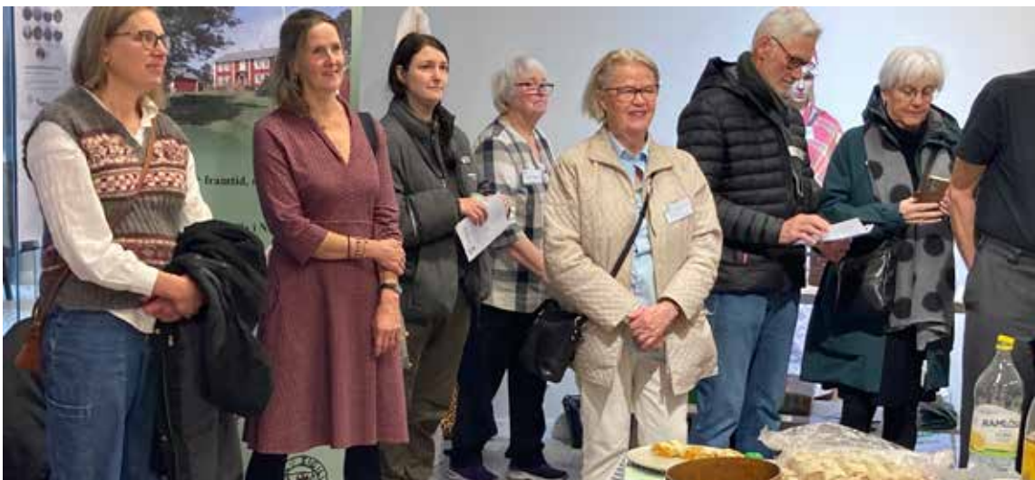
Några av hembygdsföreningarna, som deltog.