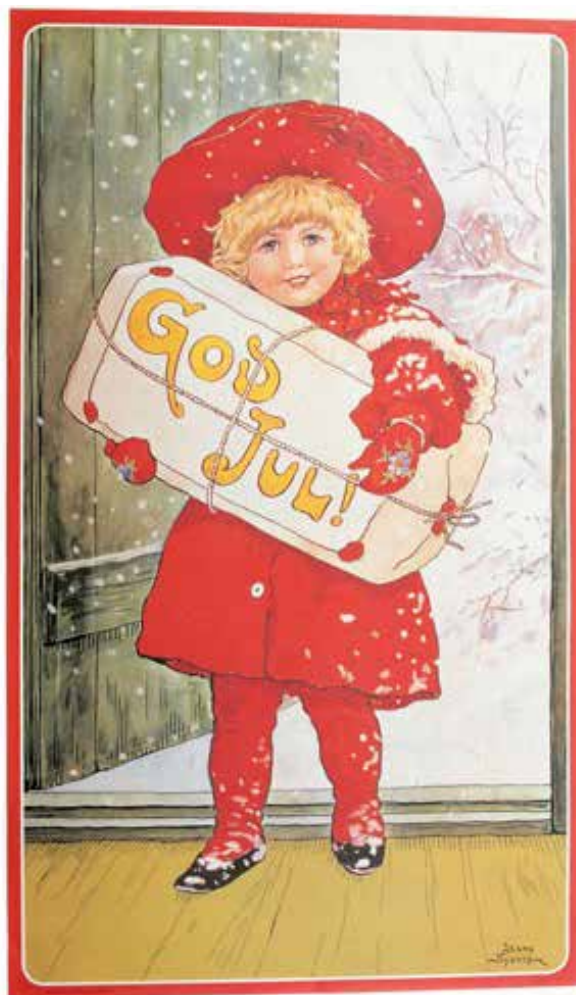
Julbild av Jenny Nyström

Dagmar Melander Bygd i Förvandling Kubbe 19