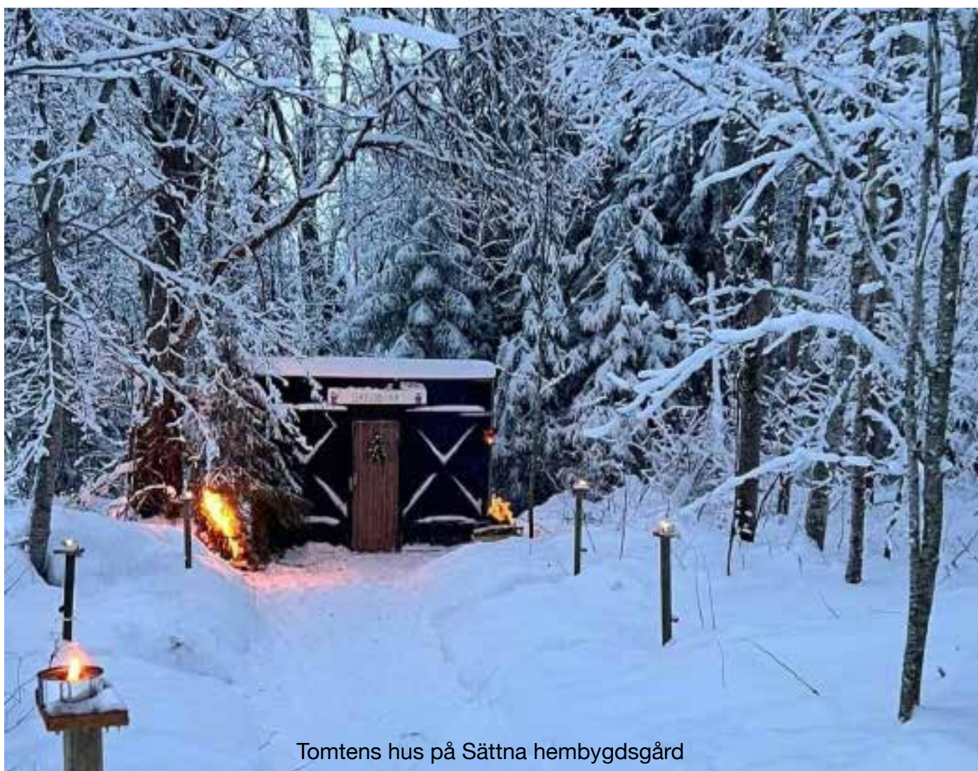
Tomtens hus på Sättna hembygdsgård