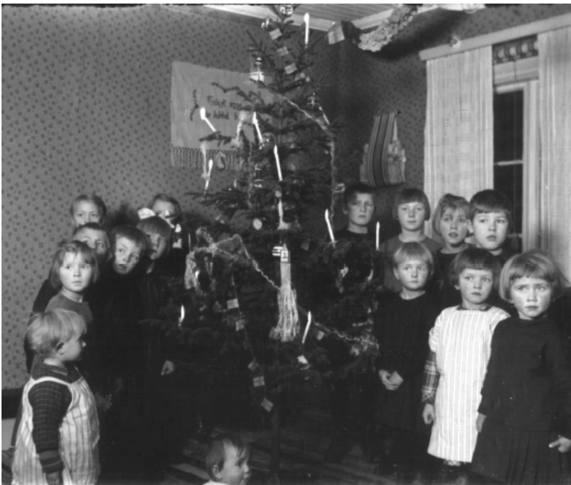
Julgransplundring i Hädanberg ca 1925.