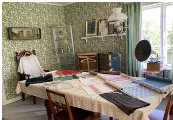
Olika alster från Vävstugan i Prästmon