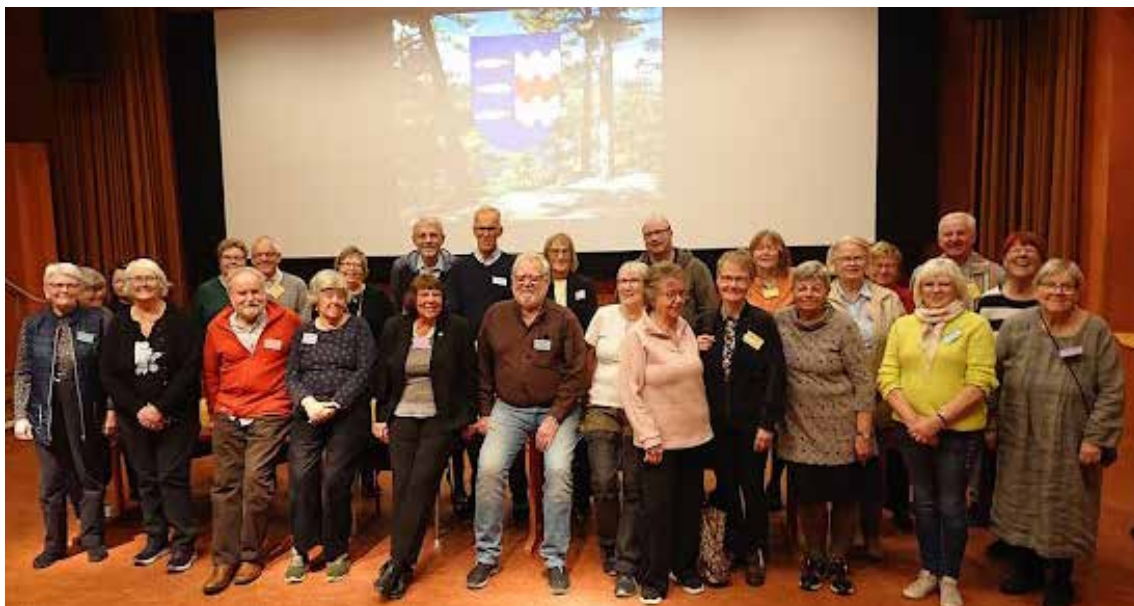
Deltagare på Höstmötet