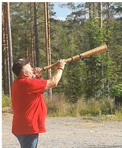
Bilder från Östanå- Bodarna