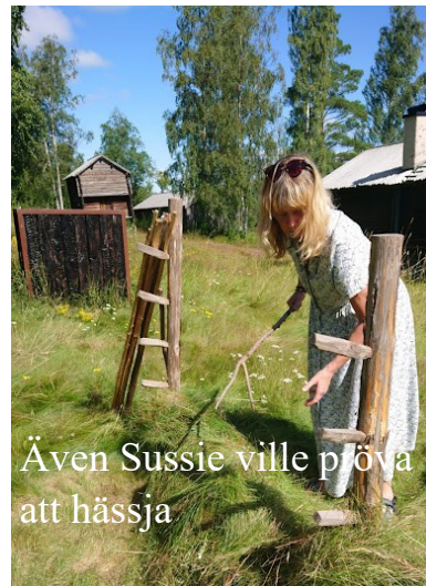
Även Sussie ville pröva att hässja