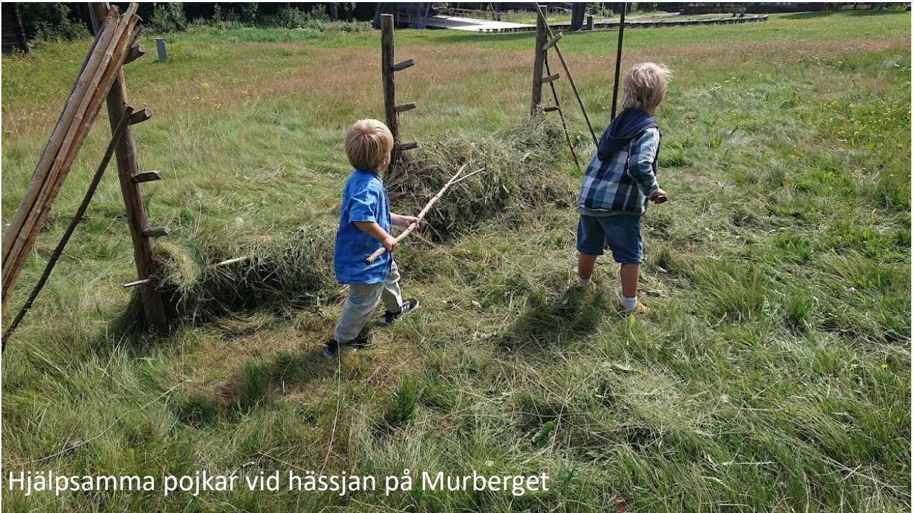
Hjälpsamma pojkar vid hässjan på Murberget