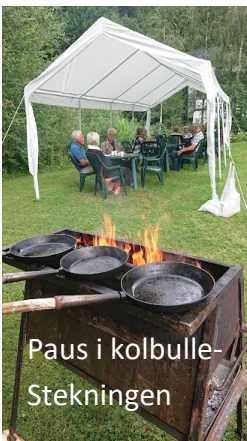
Paus i kolbulle- Stekningen

I början av augusti genomfördes även i år Wild Kids Helgum