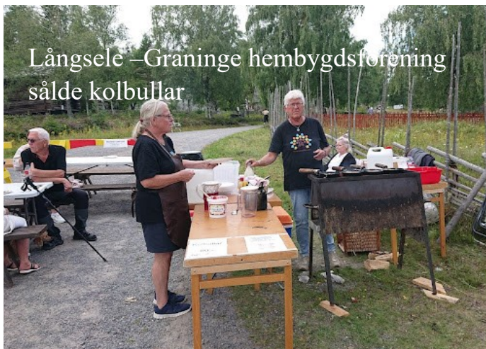
Långsele –Graninge hembygdsförening sålde kolbullar