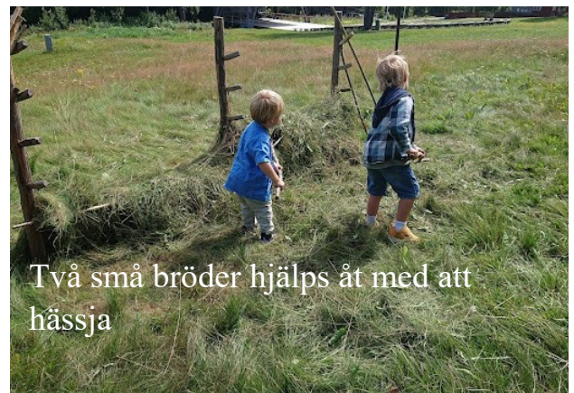
Två små bröder hjälps åt med att hässja