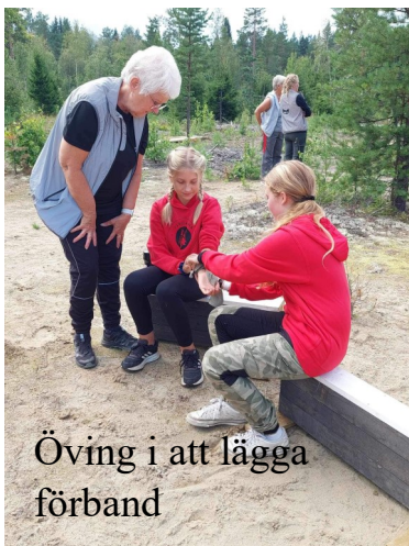
Öving i att lägga förband