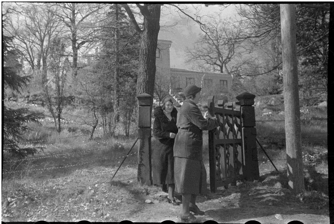
Ingången till Långängsborg på Lagman Linds väg.