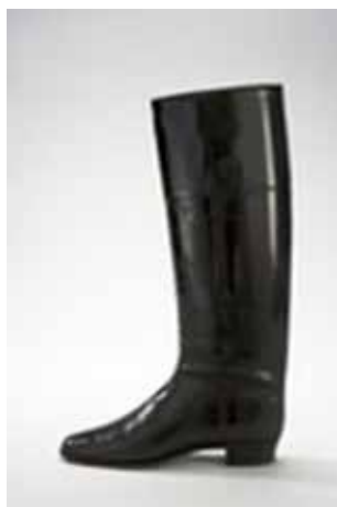
Drottning Viktorias stövel från 1910-talet. Livrustkammaren.

Från 1890-talet fanns galoscher, låga gummitråg att trä ner skorna i. De skyddade skorna från smuts och väta. I stort sett alla manliga stadsbor hade galoscher mellan 1910-talet och 1950-talet men plötsligt använde ingen galoscher. Elegant kostymrade och cyklister har dock upptäckt fördelarna med galoscher, nu i glada färger. För kvinnorna fanns prydliga galoscher med knäppe men också pampuscher och bottiner.