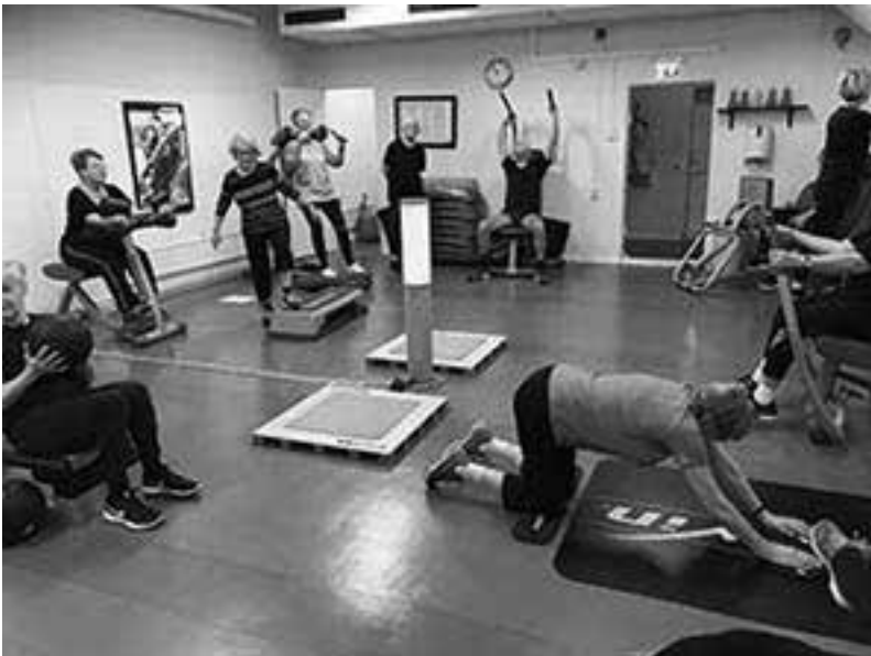
Cirkelgymmet. Varje övning är 30 sekunder följt av 30 sekunder då man byter redskap, 30 sekunders övning osv.