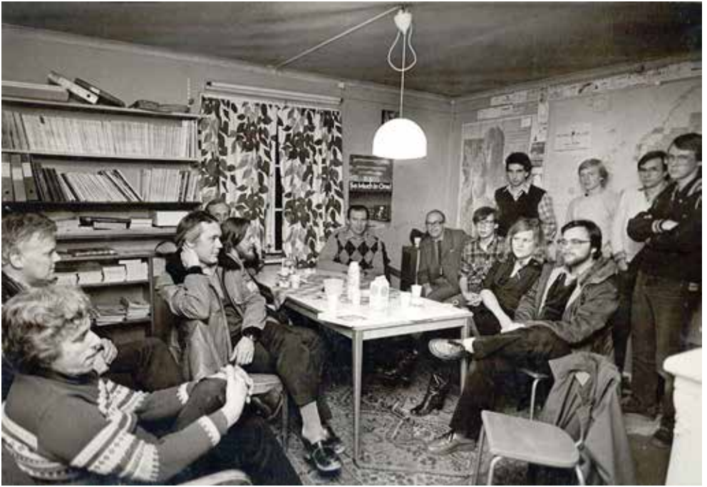
Foto från artikel i NA 12 november 1979. En enda kvinnlig medlem men stor bystbild på väggen.

1973 kunde privatradioklubben PRIÖR flytta in i den större stugan och Örebro Sändaramatörer hyrde den mindre stugan från den 8 augusti. De hade gemensam sammanträdeslokal på loftet i den större stugan. Sändaramatörerna monterade upp sin gamla mellanvågsmast som var drygt 40 m hög och kortvågsaktiviteten från SK4BX ökade kraftigt. De hade sedan 1962 tillsammans med Hjärsta scoutkår disponerat en källarlokal på Hjalmar Bergmans väg 20 men fick genom flytten mycket större möjligheter. De blev väl kända genom att ofta ordna skrävjakt då man med hjälp av radio söker en gömd person. Avsikten var att alla