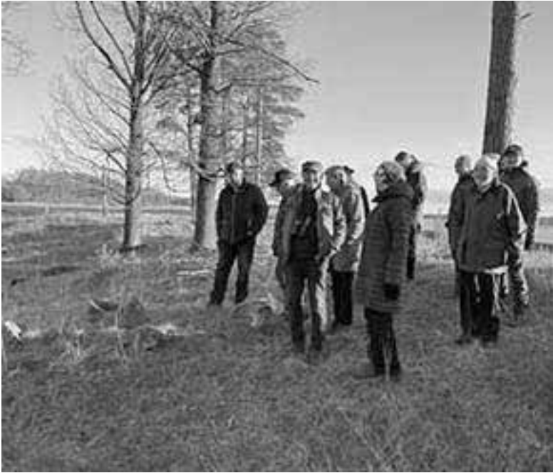
Hembygdsvörningens utflykt den 4 maj 2023 till gränsröset mellan socknarna Norrbyås, Stora Mellösa och Sköllersta.