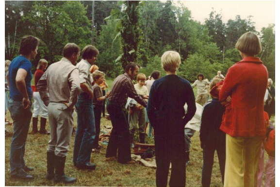
Midsommarfirande nedanför Vårås 1981