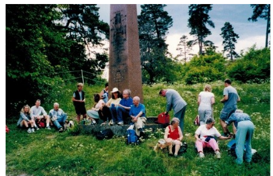
Utflykt till obeliskan och ruinen 2001.