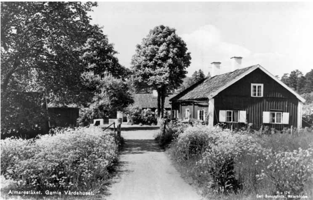
Värdshuset omkring 1930, till vänster vid vattnet ligger idag "bensinbryggan".