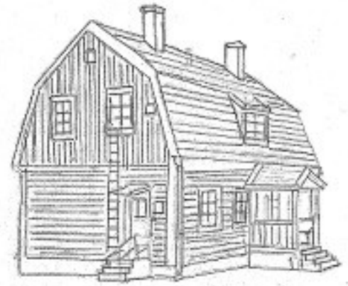
Stäketskolan / Stäkets Bygdegård