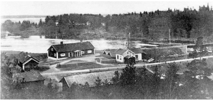
Stäketborg 1910 , vårflood med översvämningsområde och hel vattenyta mellan ruinholmen och ön, vid idag "svarta bron".