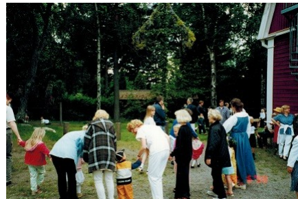
Midsommarfirande vid skolan 1998.