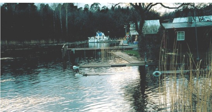
Stark vårflood 1999.