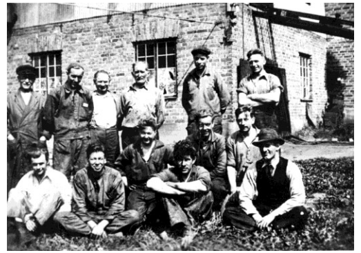
Grabbar på gjuteriet en solig dag 1937. Först sprängämnesfabrik, sedan vattenglas, slippapper, gjuterier och nu marina.