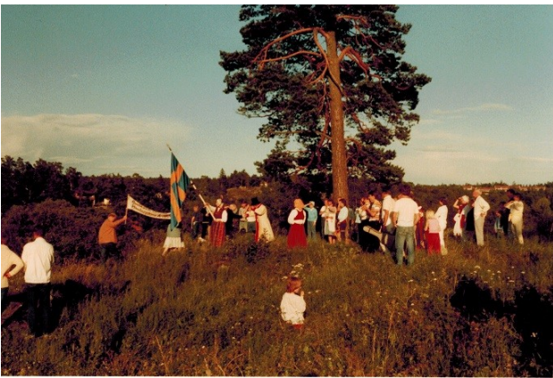
Budkavleöverlämning 1984 på Ruinkullen.