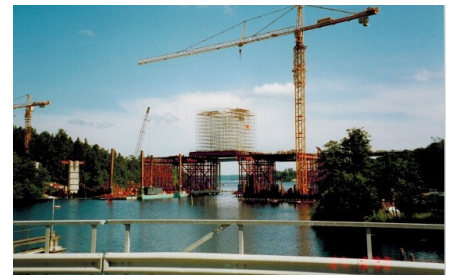
Den nya järnvägsbron påbörjades 1999.