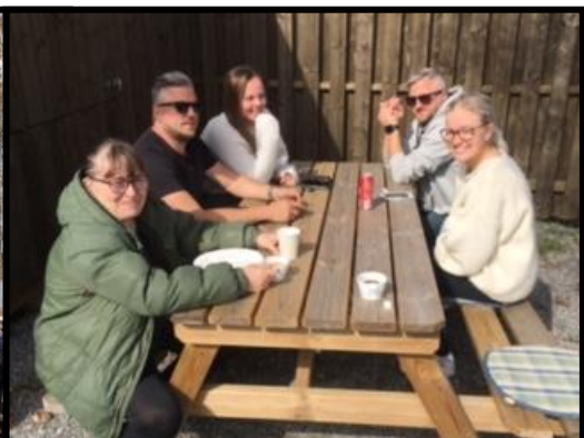
Våfflor smakar bäst på Hembygdsgården