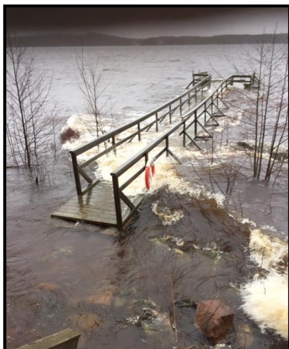
Naturens krafter rår ingen