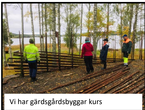
Vi har gårdsgårdsbyggar kurs