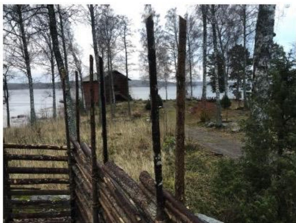
Bild Vy med hammagasin och Gläsfjorden.