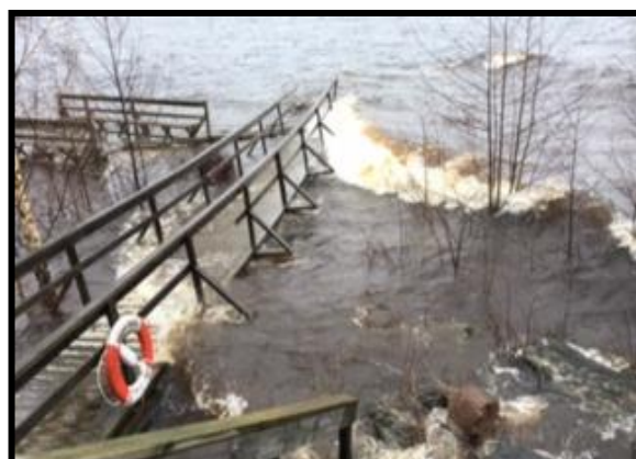
Ingen mer brygg dans i närtid

[Få läsarens uppmärksamhet med ett bra citat från dokumentet eller använd det här utrymmet för att framhäva en viktig poäng. Dra den här textrutan om du vill placera den någonstans på sidan.]