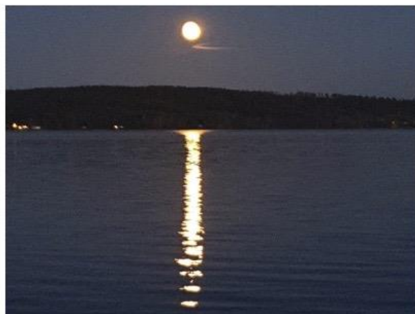
Bild Månken vid Gläsfjorden.