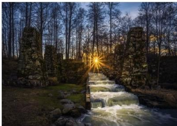
Bild Sågruin och Lextrippan vid Älgåns mynning.