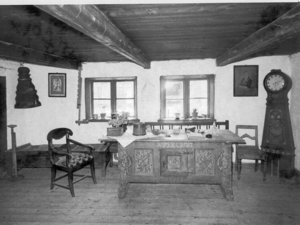
Interiör från Bondrumsgården