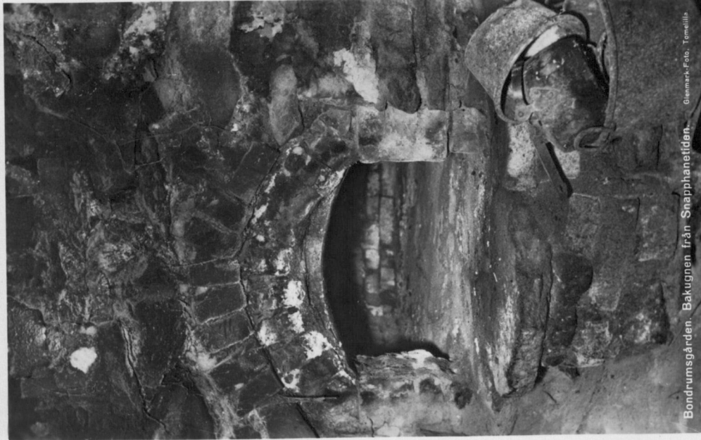
Bondrumsgården. Bakugnen från Snapphanestiden. Olemark-Foto. Tomellis