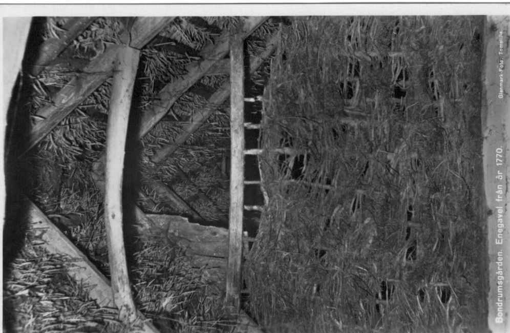
Bondrumsgården. Enegavel från år 1770.