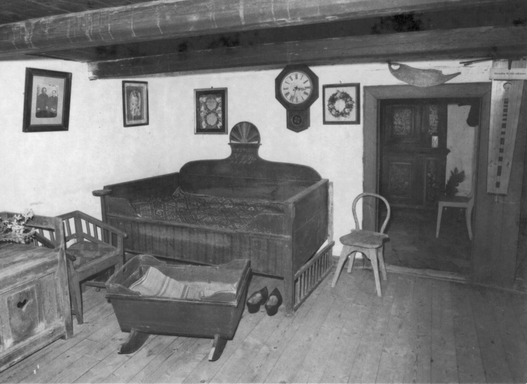
Interiör från Bontrumsgården