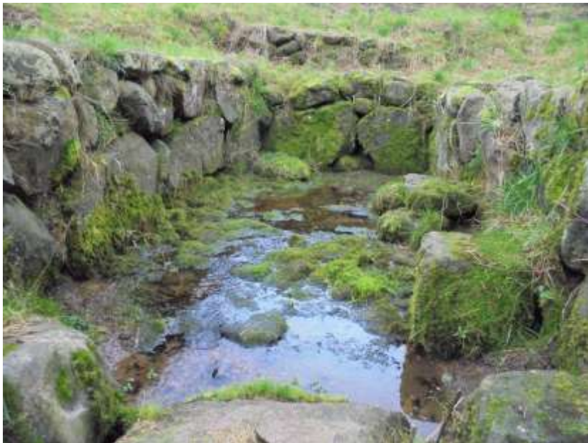
På stenen till höger skurades mattorna.