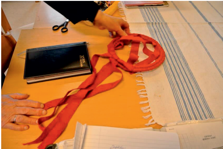
Bilden visar ett pigelock. Ogifta kvinnor använde denna förr som huvudbonad.