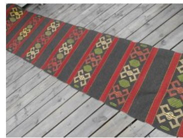
Bänkalängden i dukagång och halvkrabba.