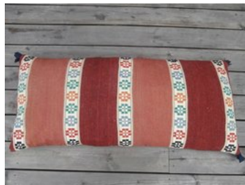
Baksidan på Prästens dyna.