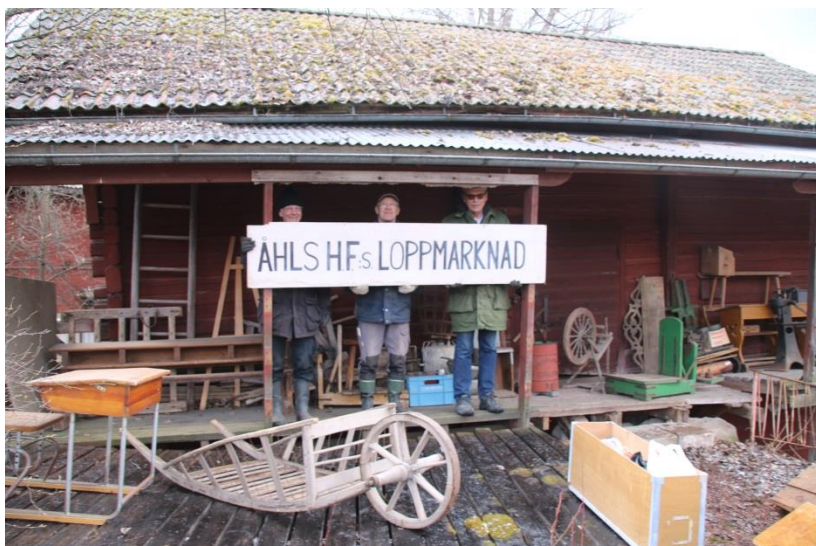
En del av lösöret

Försäljningen av "lösöret" kommer att ske på plats, adress Skogsvägen 15, Mullbacken, Insjön lördag 3 juni mellan klockan 10 och 12 . Kontant eller swish för betalning och köpta varor ska hämtas därifrån under köpdagen. Servering av kaffe/saft och bröd.