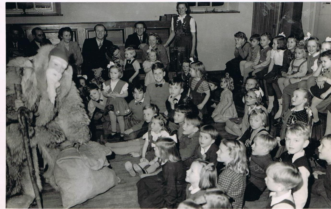
Julfest i Församlingshemmet i slutet av 1940-talet. Kan du hitta dig själv?