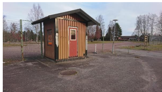
Exempel på satsningen på Insjöns IP. (jämför dikten ovan)

/Stenåke Petersson Med hjärtat i Åhl och sängen i Noret